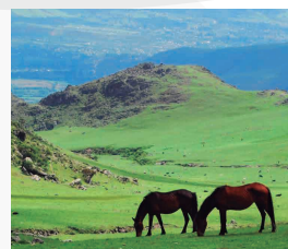
TAFI DEL VALLE