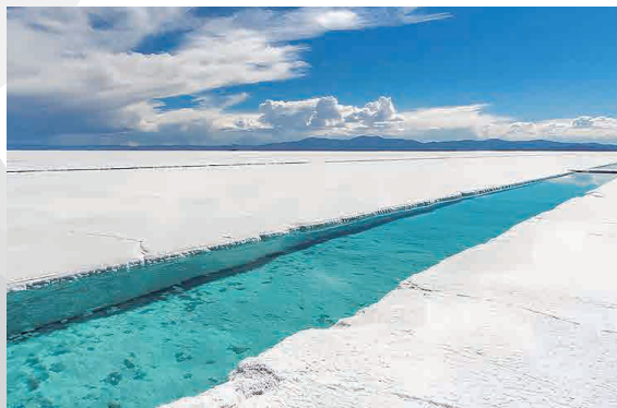
SALINAS GRANDES JUJUY